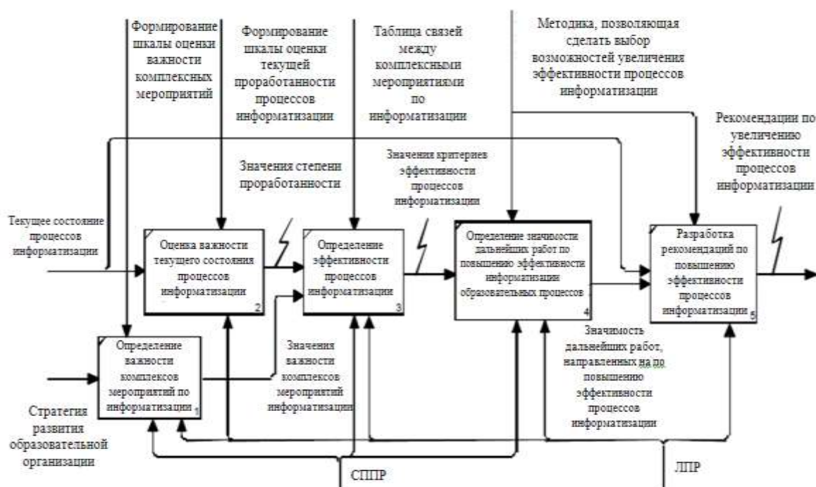
Рисунок 1 – IDEF0-диаграмма по выбору путей повышения эффективности процессов информатизации образования в военном вузе.

Мы рассматривали задачу, связанную с выбором путей повышения эффективности использования информационных технологий в процессе подготовки специалиста в военном вузе. Для того, чтобы решать такую задачу была проведена разработка системы поддержки принятия решений (СППР) (Рисунок 1), которая базируется на QFD-анализе, определенных выше комплексных целей.