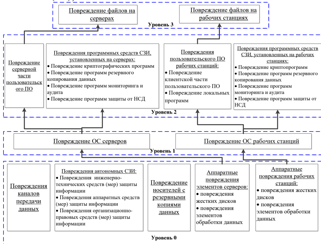
Рисунок 2 - Иерархия повреждений

отрицательный (Н-); Нулевой (0); Низкий положительный (Н+); Средний положительный (С+); Выше среднего положительный (ВС+); Высокий положительный (В+)}.