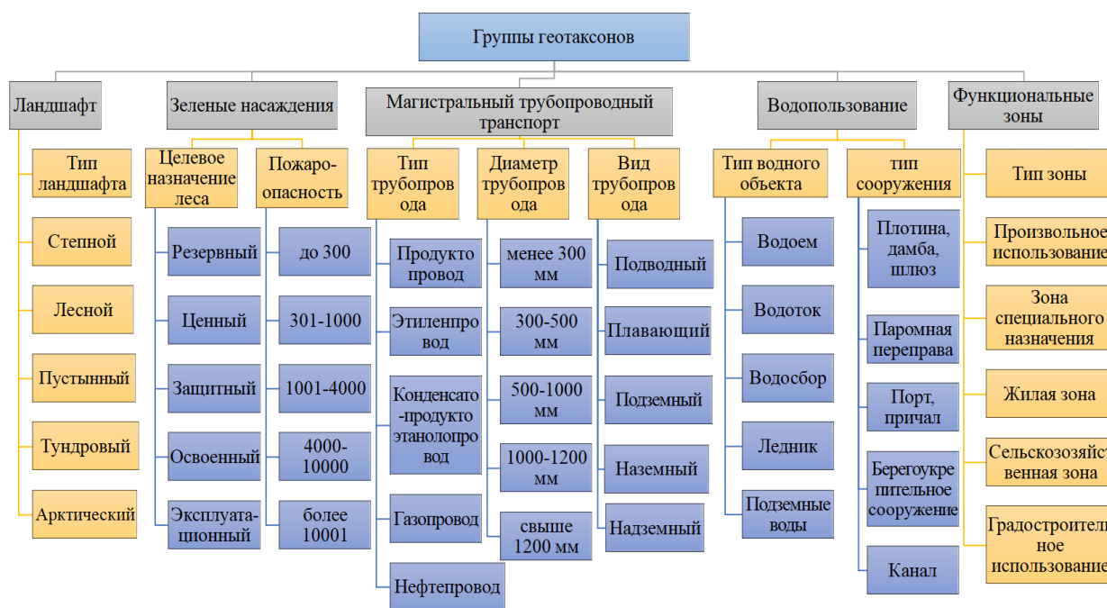
Рисунок 1 – Классификация групп геотаксонов Figure 1 – Classification of groups of geotaxons

В связи с необходимостью обобщения и упорядочивания большого объема разнородных данных, а также для понимания группы объектов, которые обладают индивидуальными параметрами, отличающими их от других объектов, разумно ввести классификацию групп геотаксонов на основе множества информативных параметров.